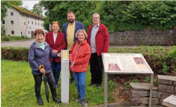
Via Nova-Hörstation bei der Kapelle „Maria Hilf“ in Ibm

An diesem besonderen Platz treffen sich der 1200 km lange Europäische Pilgerweg Via Nova, der durch Deutschland