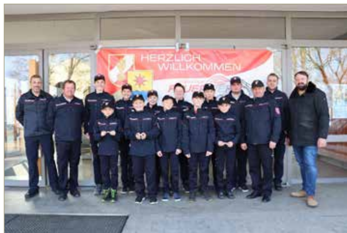
Abschlussfoto gemeinsam mit der Jugendgruppe der FF Ibm