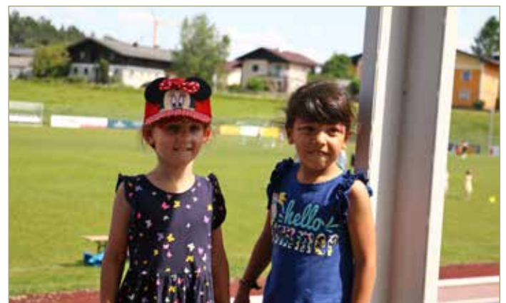
Ein gelungener Schnappschuss am Sommerfest

Bei herrlichem Sommerwetter fand am 02.06. unser Sommerfest am Sportplatz Eggelsberg statt. Danke an den USV Eggelsberg-Moosdorf, der uns die Räumlichkeiten für das Fest zur Verfügung gestellt und für den Ausschank der Getränke gesorgt hat. Mit vielen Spielstationen, Kinderschminken, köstlichen Speisen der Eltern und einem Eiswagen konnten die Kinder und Eltern das Fest in vollen Zügen genießen. Danke für die zahlreiche Teilnahme - wir freuen uns sehr, dass wir miteinander feiern konnten. Zum Schluss möchten wir uns noch bei allen Kolleginnen und Kollegen der Gemeinde für die gute Zusammenarbeit bedanken.