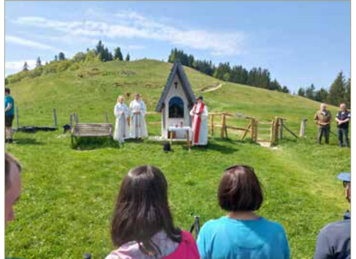
Bergmesse Loibersbacher Höhe