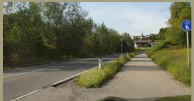
Sichtweite bei den Ausfahrten „Siedlung Kleinschäding und Höhe Kuglerwirt“.

Schon das Überprüfen der bestehenden Geschwindigkeitsbeschränkung könnte zu mehr Sicherheit führen, dann wäre nämlich auch das Ansetzen des Überholvorganges zum Teil unterbunden, gerade auf jenem Streckenabschnitt, der zu einem „Blindflug“ des Überholers führt. Für eine Verminderung der Gefahrenquellen wird weiter daran gearbeitet.