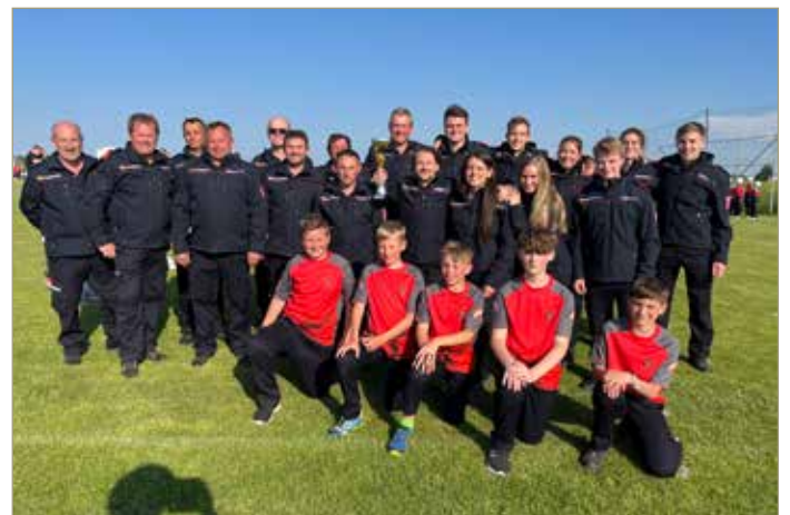
Bewerbungsgruppen beim Abschnittsbewerb in Gilgenberg

Seit heuer ist die Feuerwehr Ibm wieder in doppelter Mannschaftstärke unterwegs, was bedeutet, dass wir mit zwei Bewerbungsgruppen antreten. Eine junge, gemischte Aktivgruppe aus FF-Frauen und Männern sowie unsere altbewährte Altersgruppe. Beim ersten Bewerb in Gilgenberg konnten beide Gruppen ihr Können unter Beweis stellen. Die Aktivgruppe erreichte den 3. Platz in Silber, die Altersgruppe den 3. Platz in Bronze.